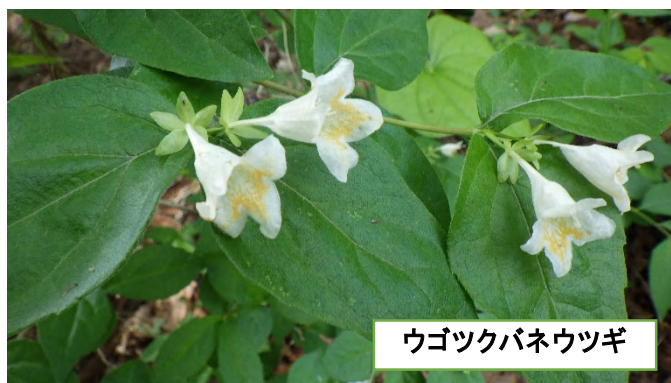
ウゴツクバネウツギ