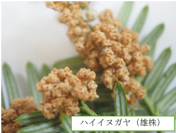
ハイイヌガヤ (雄株)