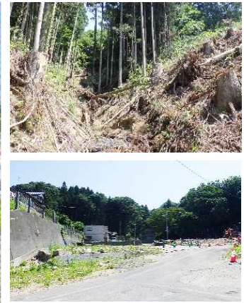
災害現場の土石流・流木跡（上）と 片付けられ整地された現場（下）